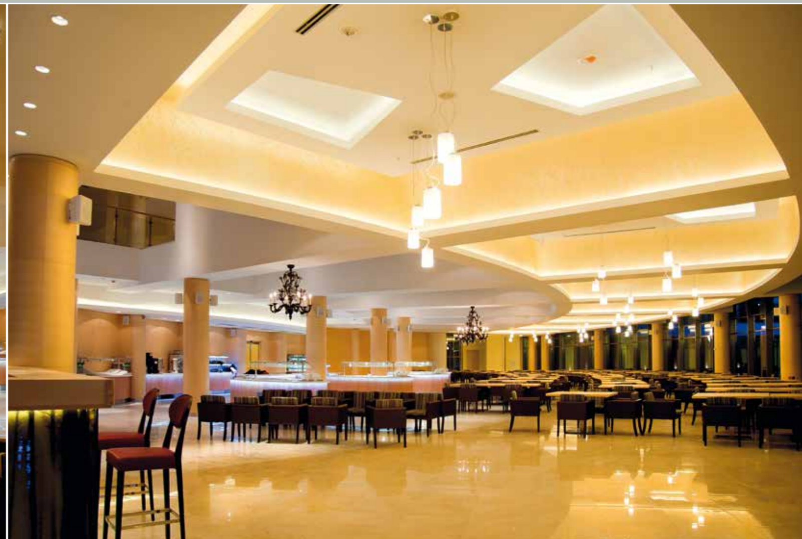
Отель ЮЖНЫЙ, Сочи