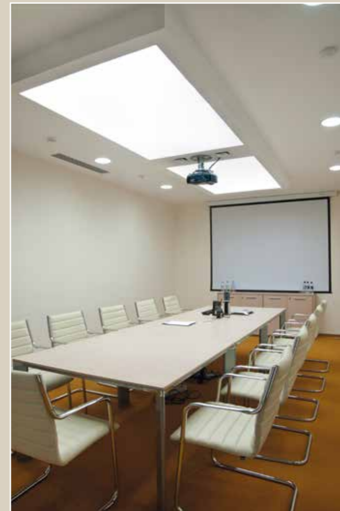
ПРОГРЕСС ФУД (ФРУТО НЯНЯ), Москва Партнер: Prometheus