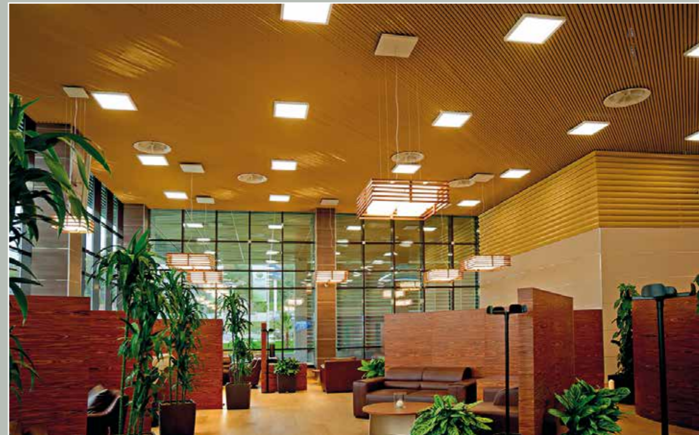
Аэропорт АДЛЕР, VIP зона