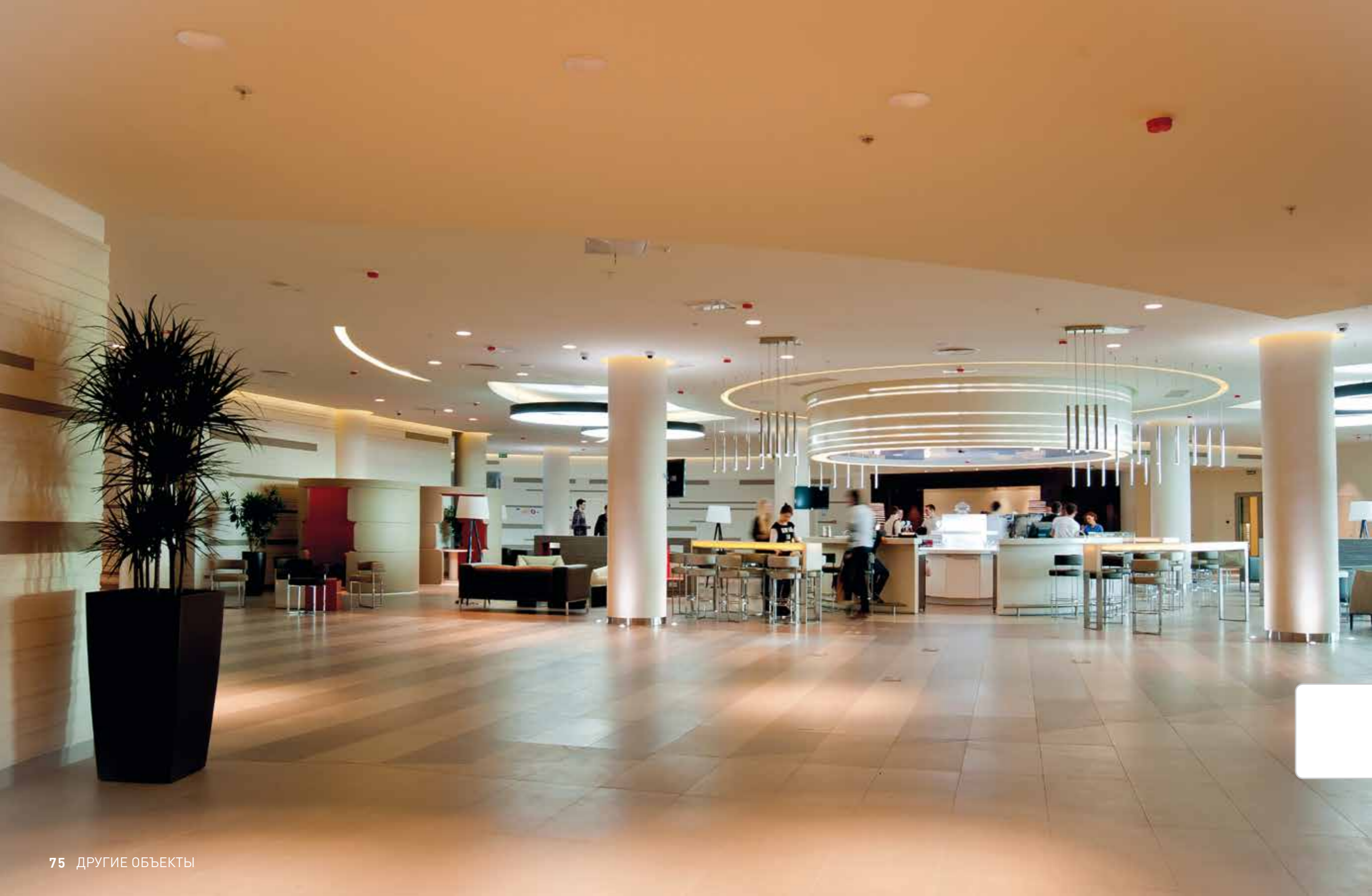
Отель PULLMAN И MERCURE Сочи Центр