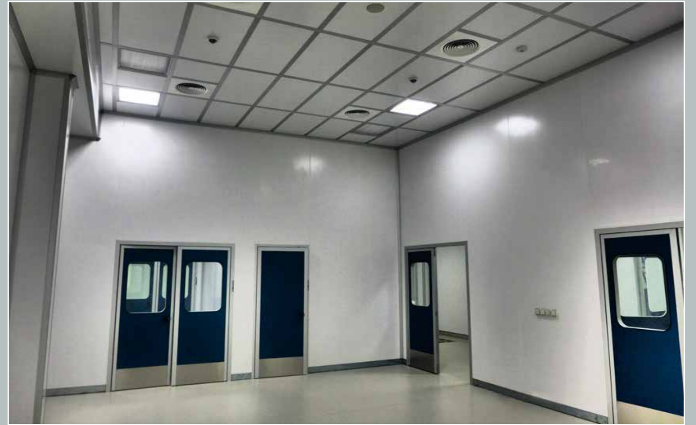
Astra Zeneca, Калужская область