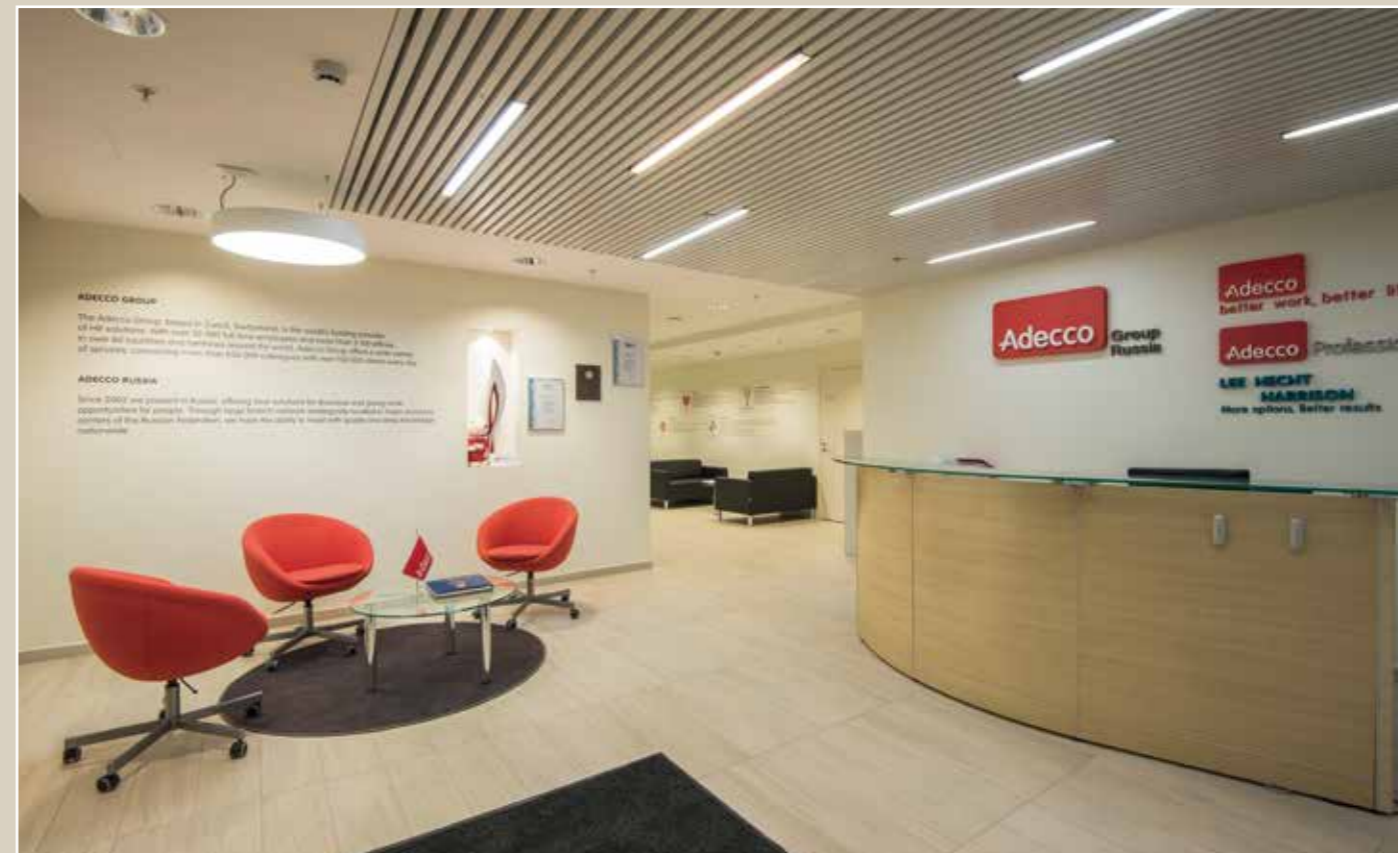
ADECCO GROUP, Москва Партнер: Prometheus